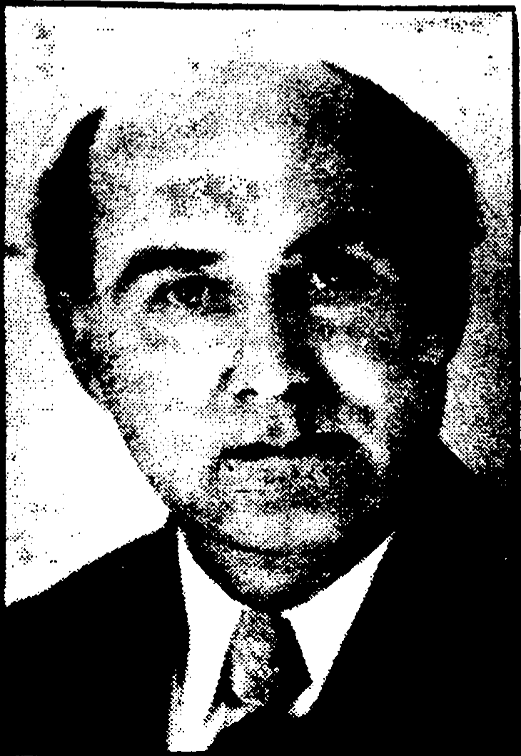
dr. JOHANNES VARES-BARBARUS.